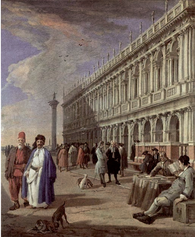
CARLEVARIS, L. La piazzetta (detalhe). Óleo sobre tela, 49 × 41 cm. Ashmolean Museum, Oxford, 1729.

Disponível em: www.meinsterart.de . Acesso em: 13 dez. 2017.