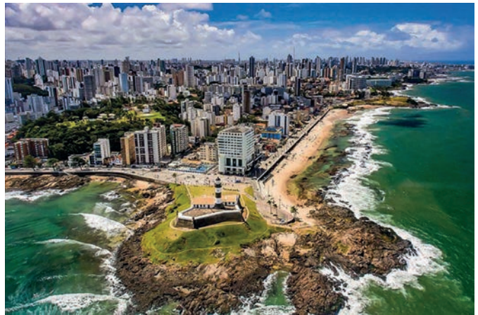
Salvador, capital do estado da Bahia.

Disponível em: https://mundoeducacao.uol.com.br . Acesso em: 20 out. 2023.