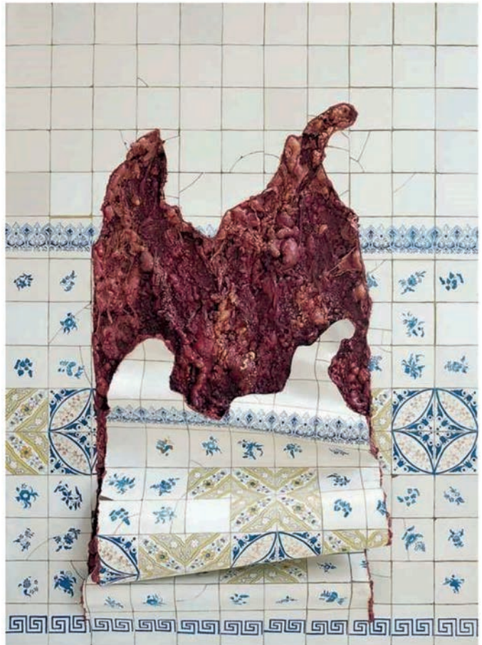
VAREJÃO, A. Azulejaria em carne viva . Óleo sobre tela, poliuretano, madeira e alumínio, 160 × 200 × 25 cm. 1999.

Disponível em: www.adrianavarejao.net . Acesso em: 10 jan. 2025.