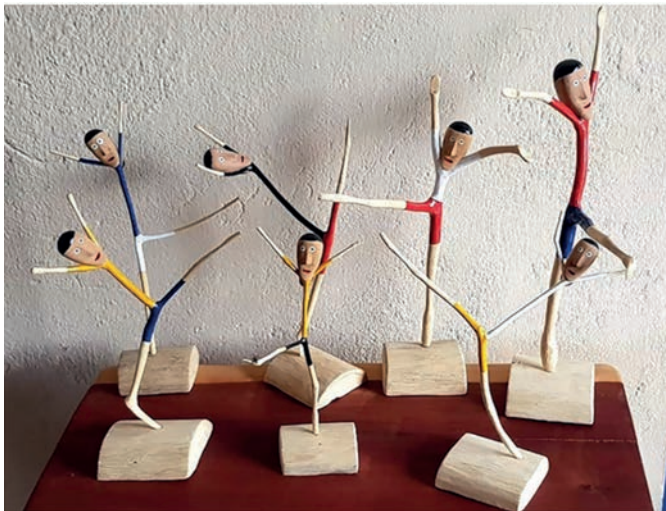
FARIAS, Y. Bailarino entalhado em gravetos de madeira . Artesanato em madeira, 20 × 13 × 51 cm. Ilha do Ferro (AL).

Disponível em: www.nidelins.com.br . Acesso em: 5 fev. 2025.