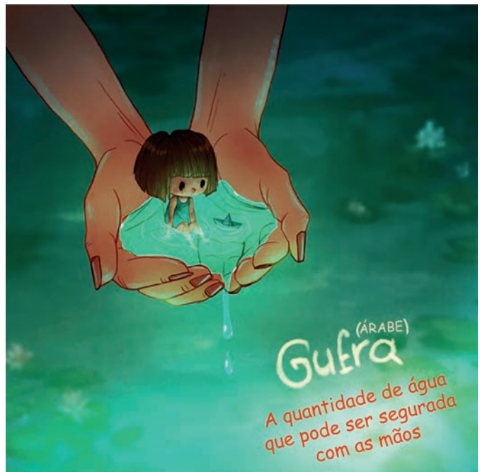
ROMANZOTI, N. 9 desenhos que ilustram palavras sem tradução para o português. Disponível em: https://hypescience.com . Acesso em: 10 jun. 2019 (adaptado).

A artista Marija Tiurina criou uma série chamada Palavras intraduzíveis , com diversas ilustrações detalhadas que transmitem o sentido desses vocábulos, que nenhuma palavra única em outras línguas pode descrever.