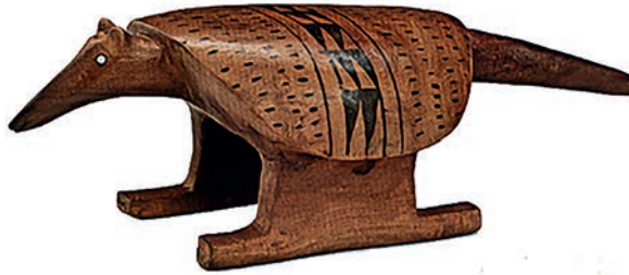
KAMAYURÁ, Y. Tatu Kamayurá 1 . Madeira, 61 × 24 × 20 cm. Xingu (MT), s.d.

Disponível em: www.colecaobei.com.br . Acesso em: 15 out. 2024.