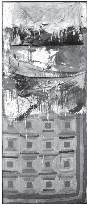
RAUSCHENBERG, R. Cama . Óleo e lápis em travesseiro, colcha e folha em suporte de madeira. 191,1 x 80 x 20,3 cm. Museu de Arte Moderna de Nova York, 1995. Disponível em: www.moma.org . Acesso em: 8 jun. 2017.