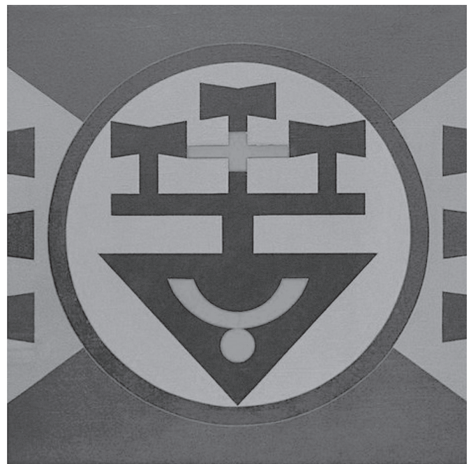
VALENTIM, R. Emblema 78 . Acrílico sobre tela. 73 x 100 cm. 1978.

Disponível em: www.espacoarte.com.br . Acesso em: 2 ago. 2012.