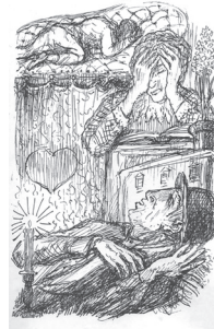
Alfred Kubin, representante do Expressionismo.