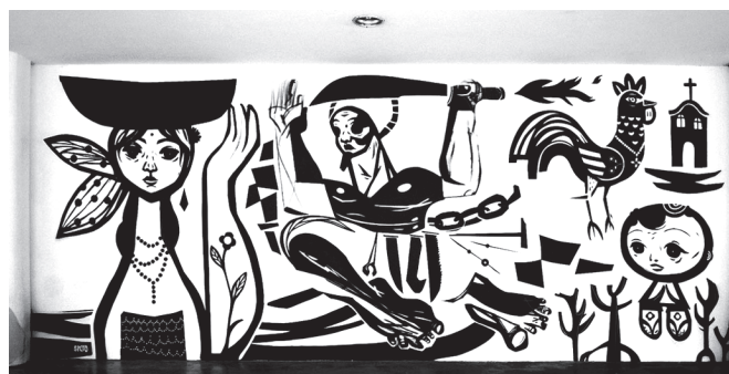
SPETO. Grafite . Museu Afro Brasil, 2009.

Disponível em: www.diariosp.com.br . Acesso em: 25 set. 2015.