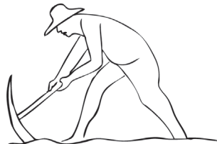
Diego Rivera, representante do Muralismo.