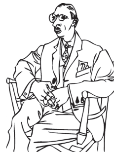
Pablo Picasso, representante do Cubismo.