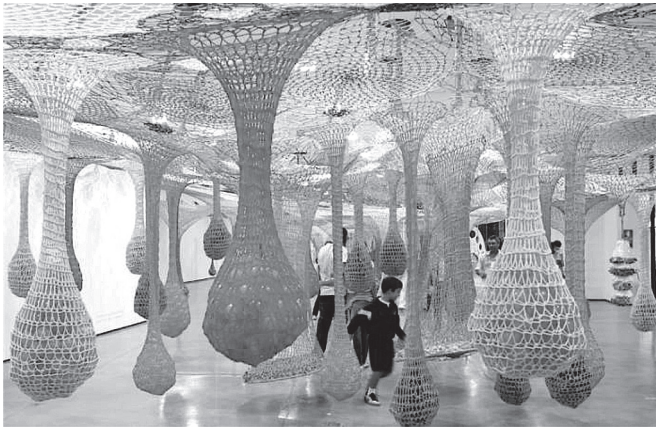
ERNESTO NETO. Dengo . 2010. MAM-SP, 2010.

Disponível em: http://espacohumus.com . Acesso em: 25 abr. 2017.