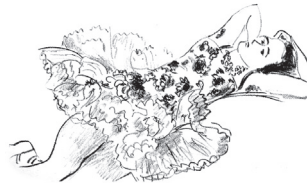
Henri Matisse, representante do Fauvismo.