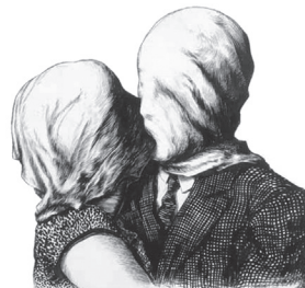
René Magritte, representante do Surrealismo.