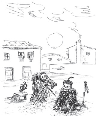
GOELDI, O. Sem título . Bico de pena, 29,4 x 24 cm. Coleção Ary Ferreira Macedo, circa 1940.

Disponível em: https://revistacontemporartes.blogspot.com.br . Acesso em: 10 dez. 2012.