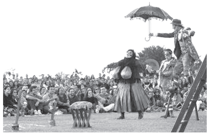
Espectáculo Romeu e Julieta , Grupo Galpão.

GUTO MUNIZ. Disponível em: www.focoincena.com.br . Acesso em: 30 maio 2016.