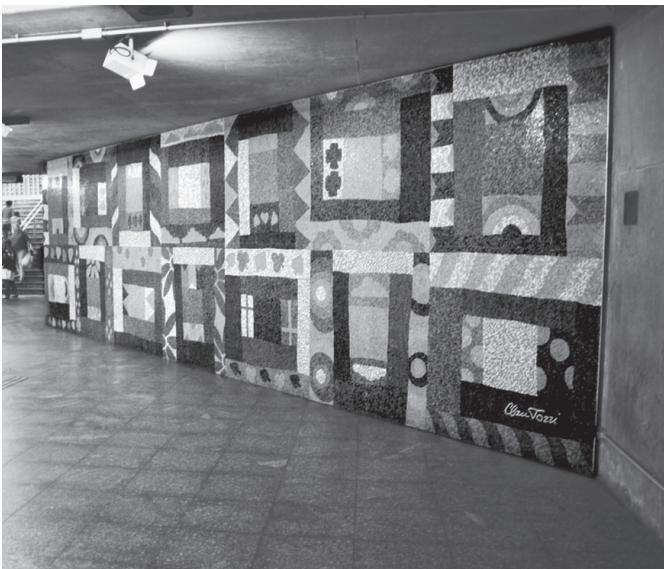
TOZZI, C. Colcha de retalhos . Mosaico figurativo. Estação de Metrô Sé. Disponível em: www.arteforadomuseu.com.br . Acesso em: 8 mar. 2013.

Colcha de retalhos representa a essência do mural e convida o público a