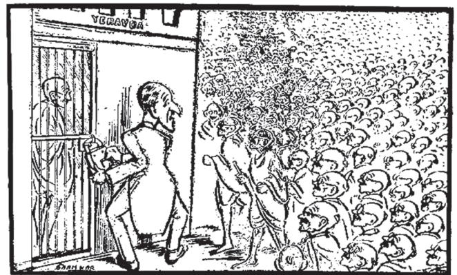
LORD WILLINGDON'S DILEMMA