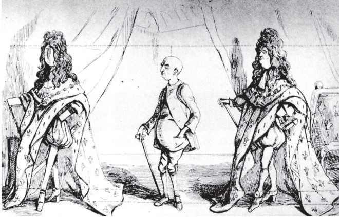
Charge anônima. BURKE, P. A fabricação do rei . Rio de Janeiro: Zahar, 1994.

Na França, o rei Luís XIV teve sua imagem fabricada por um conjunto de estratégias que visavam sedimentar uma determinada noção de soberania. Neste sentido, a charge apresentada demonstra