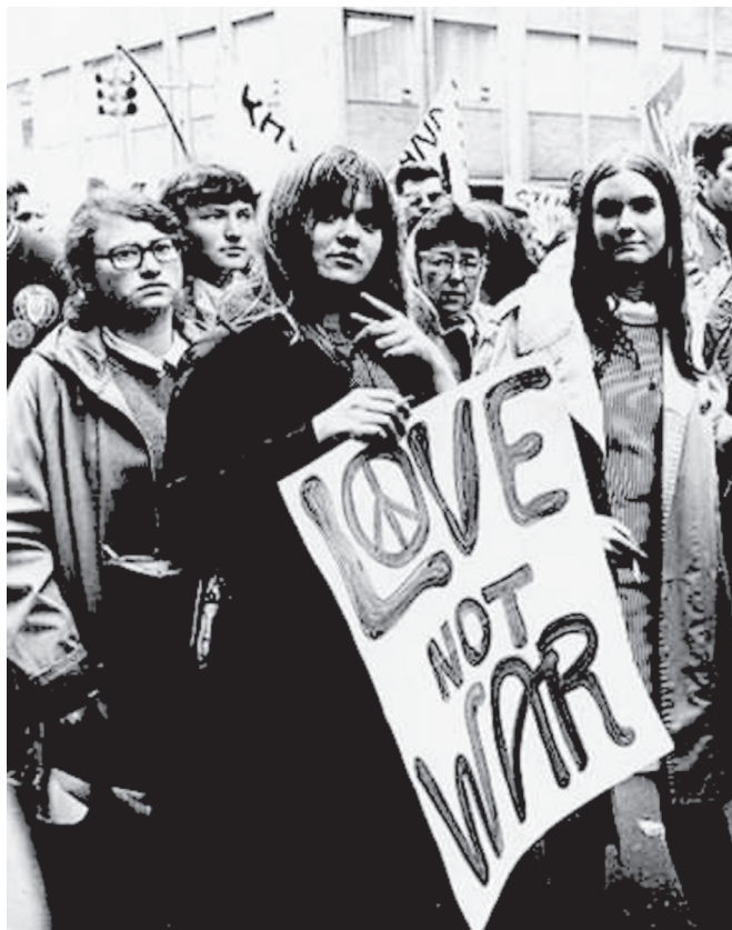
Texto do Cartaz: “Amor e não guerra”

Foto de Jovens em protesto contra a Guerra do Vietnã. Disponível em: http://goldenyears66to69.blogspot.com . Acesso em: 10 out. 2011.